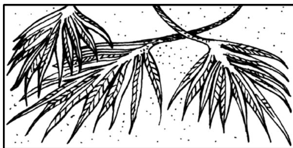
© J. S. Paluch Co., Inc. – Filipenses 2:9